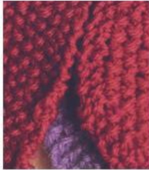
بافت خزّه ای

این بافت با شالوده ای زیر و ناهموار که با بافت از زیر و از رو فرم داده می شود. دانه هایی که در یک رج از زیر بافته می شوند، باید در رج بعد هم از زیر بافته شوند و دانه هایی که در یک رج از رو بافته می شوند، دوباره باید در رج بعد از رو بافته شوند، در نتیجه بافتی دور و ناهموار که لبه های بافت لوله نمی شوند را ایجاد می کند.