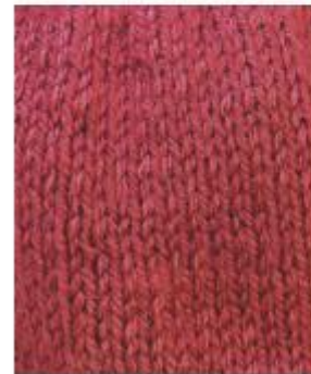
بافت صاف یک رج از زیر، یک رج از رو

از این بافت در بسیاری از بافتنیها استفاده می شود که رجهای یک در میان یک رج از زیر و یک رج از رو بافته می شوند و سمتی که بافت از زیر را می بافید روی کار می باشد و صاف و یکدست است و سمتی که بافت از رو بافته می شود پشت کار می باشد، شما راه راه های نزدیک به هم افقی را که از بافت همه رج از زیر یا همه رج از رو به هم نزدیکتر هستند را می بینید، در بافت صاف لبه ها لوله می شوند و لازم است که حاشیه بافی شود یا درز گرفته شوند تا صاف قرار بگیرند.