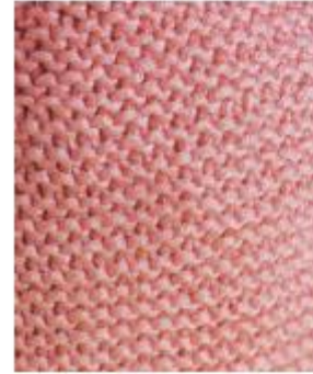
بافت همه رج از زیر یا همه رج از رو

بافت رکم (بافت همه رج از زیر یا همه رج از رو) زمانیکه تمام رجهای بافت را از زیر یا از رو ببافید این بافت شکل می گیرد. نتیجه بافت بصورت راه راه های عمودی می باشد که لبه های بافت لوله نمی شوند.