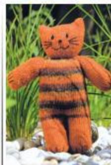
گریه کوچولو سرمایی