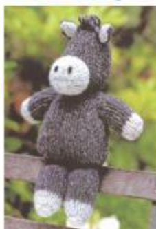
آلاخ کوچولو متعجب