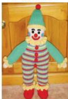
دلکش کوچولوی با مزه