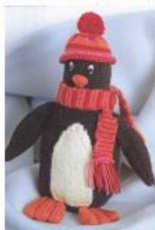
پنگوئن شمال و کلاه کرده