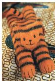
آقا ببره دوست جنگلی