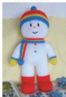
آدم برفی کوچولو