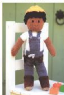
آقا مهندس جابک