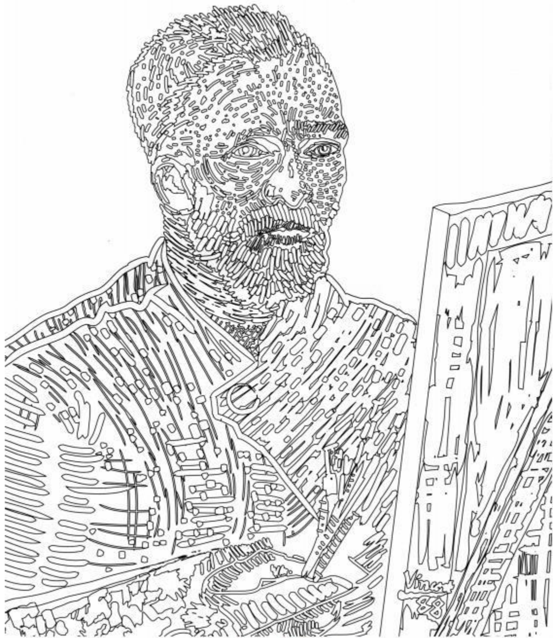
نقاشی وان لوت از صخره خورش - ۱۸۸۸