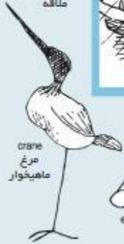
crane مرغ ماهیشوار