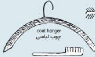
coat hanger چوب لباسی