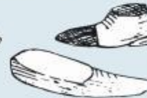
2 shoes ۲ ننگہ کفش